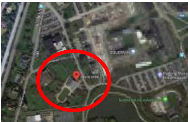
't Bosjoenk (zinnialaan 1)