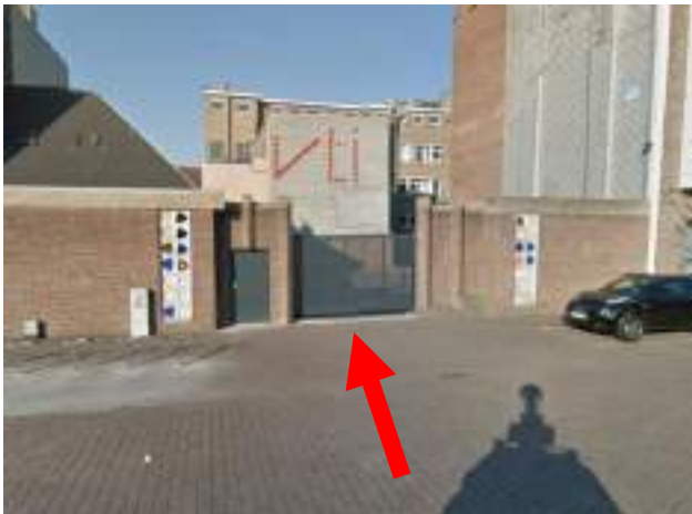
VTI kleine poort (stuiverstraat 84)